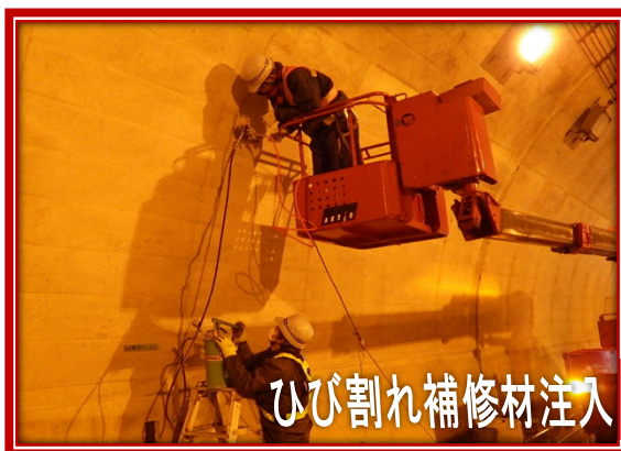
ひび割れ補修材注入