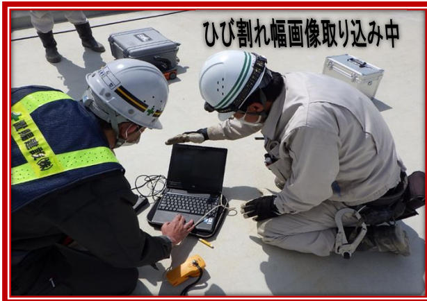
ひび割れ幅画像取り込み中